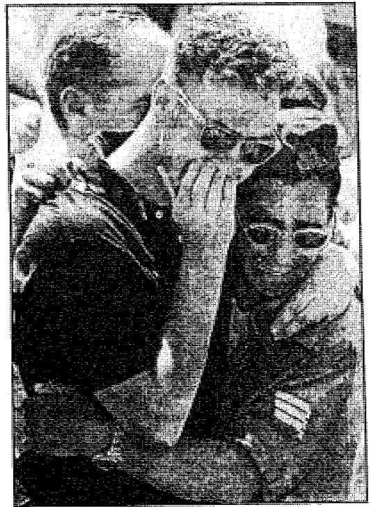
دموع الشيطان .. جنود الاحتلال الإسرائيلي